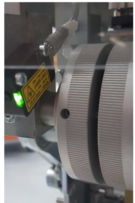
Tre differenti modalità di lavoro: con sensore ottico, con pedale o con fermo pneumatico