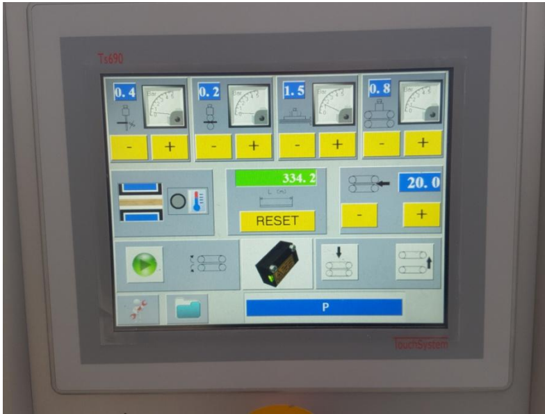
Touch panel con icone semplici e intuitive. Possibilità di salvare le impostazioni di esercizio per ogni essenza